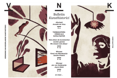
De covers van de bulletins die zijn verschenen in 2020.